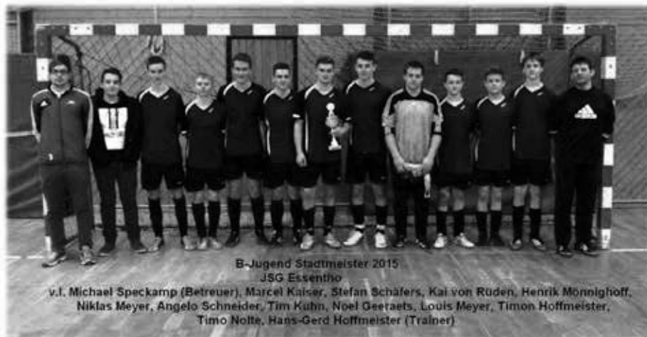
B-Jugend Stadtmeister 2015 JSG Essentho